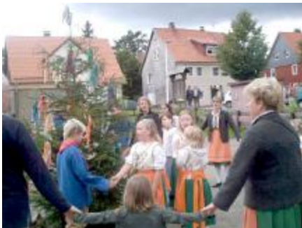
Tanz um den Baum

Im Harz ist dieses Fest einerseits aus den heidnischen Sonnenwendfeiern mit Fruchtbarkeitsfesten, sowie andererseits aus dem kirchlichen Ehrenfest für Johannes den Täufer zusammengewachsen. Darum wird an diesem Tage auch um einen mit bunt bemalten Eiern geschmückten Baum getanzt.