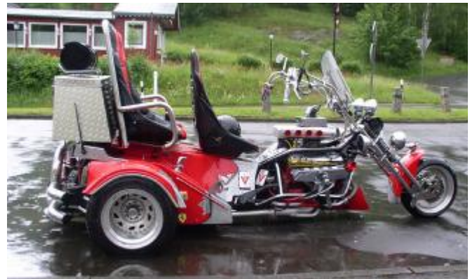
Trike mit V-8-Maschine

verdecken eignen sie sich nur für Schönwetterfahrten, also als reine Spaßfahrzeuge.