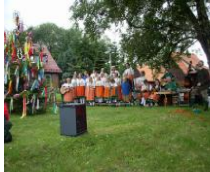
Der Heimatbund singt

feier sowohl an der Kirche, als auch auf dem Place de Touques merklich, als letztes Jahr.