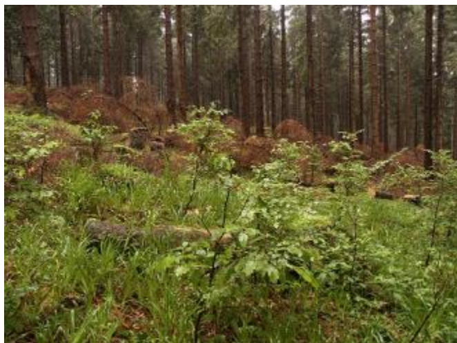
Buchenvoranbau als aktive Waldentwicklungsmaßnahme in einem standortsfremden Fichtenreinbestand; Foto: Nationalpark Harz,

Die im Nationalpark Harz durchaus erheblichen standörtlichen Unterschiede und Rahmenbedingungen erfordern – bei gemeinsamen Grundsätzen für die Waldentwicklung im Nationalpark Harz – ein Vorgehen, das den unterschiedlichen naturräumlichen Bedingungen Rechnung trägt.