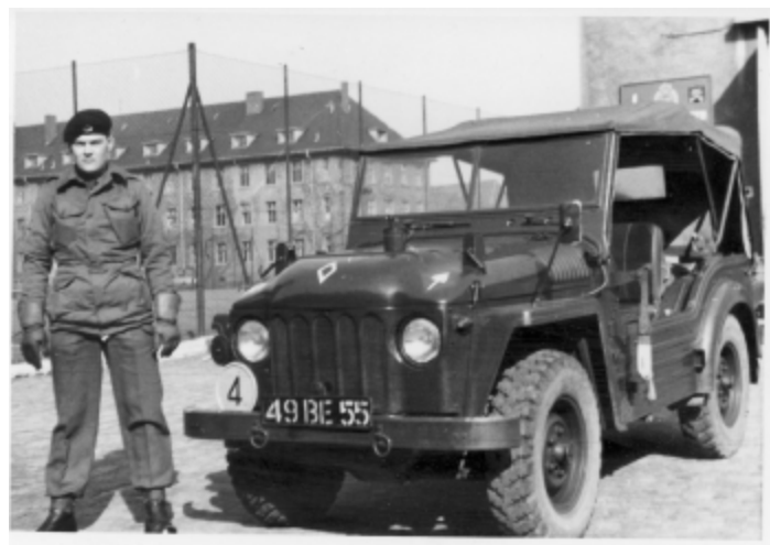
"Combat Truck" (Kampwagen/Einsatzwagen)

Auf ihrer Tour durch Deutschland kommen die Clubmitglieder mit Ihren Fahrzeugen am 24. Mai auch nach Sankt Andreasberg.