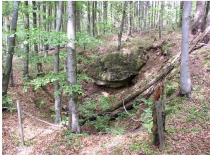
Ein Loch im Boden mit einem mächtigen Stein darüber, eingezäunt, weil es tief sein könnte