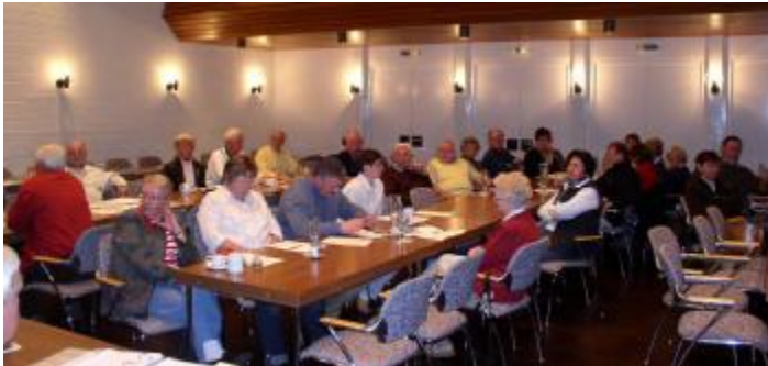
Ein schwach besetzter Saal

Der Kur- und Verkehrsverein Sankt Andreasberg hatte am Montag zur öffentlichen Jahreshauptversammlung ins Kurhaus von Sankt Andreasberg eingeladen. Ca. 32 Mitglieder und einige Gäste waren der Einladung gefolgt.