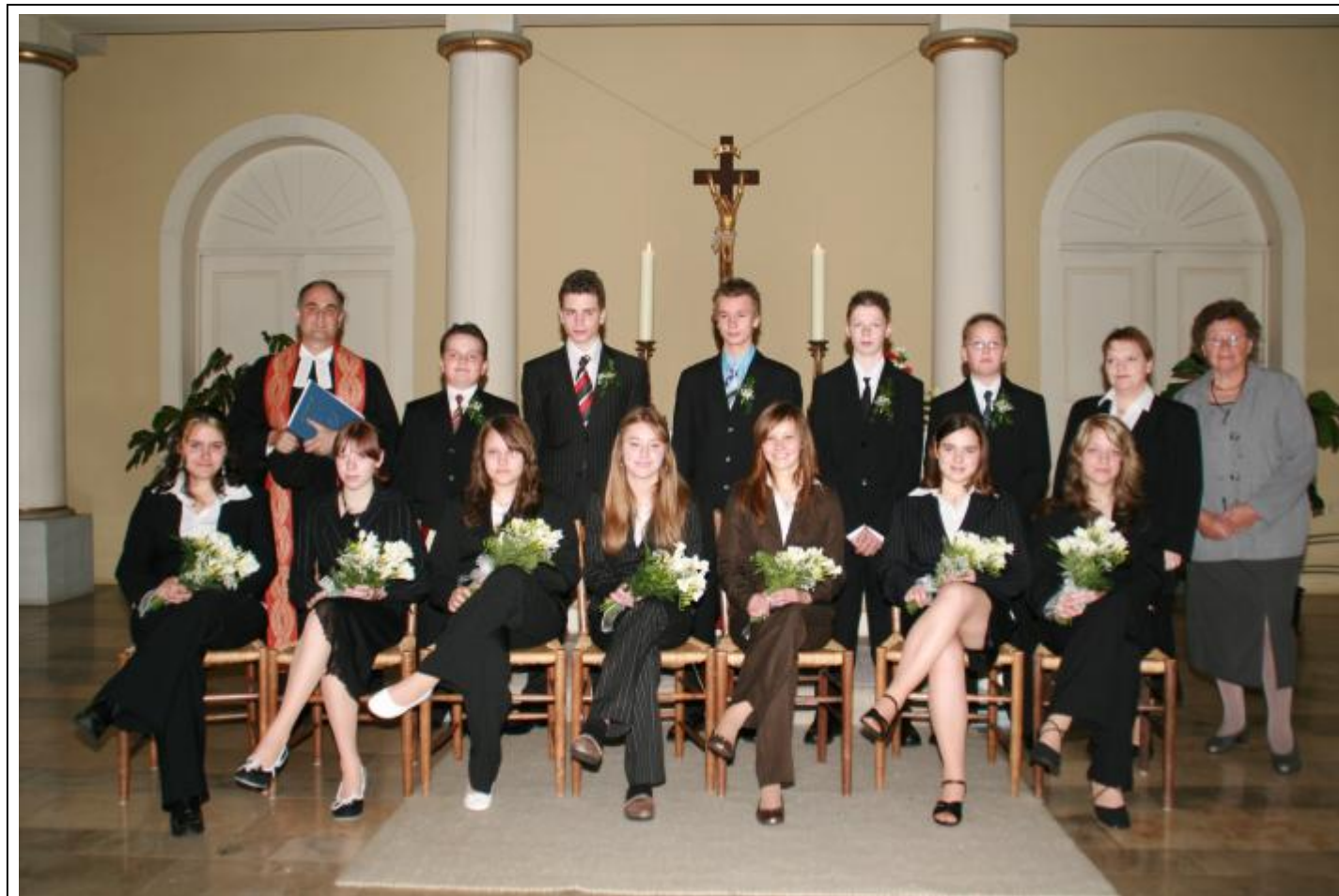
Foto: Foto-Stille. Weitere Bilder unter www.Harzbild-Foto-Stille.de