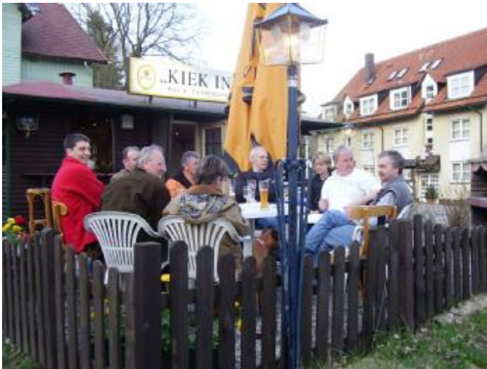
Gründungssitzung am 03. Mai 2006

Was irgendwann im Herbst 2005 als Kneipenulk eronnen wurde, läuft inzwischen schon ein Jahr. Anfangs ehrenamtlich und durch viele Helfer gestützt, entstand die Bergpost Annerschbarrich am 03. Mai des Jahres 2006 in ihrer konstituierenden Sitzung im Kuckuck.