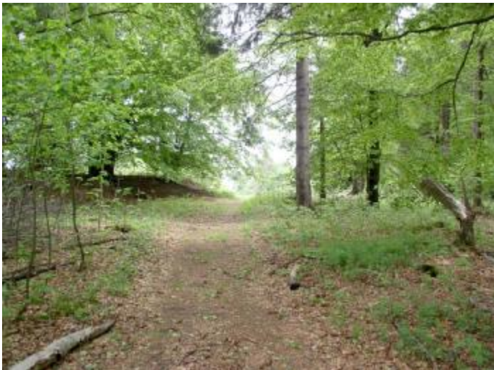
Eine liebliche Wiese liegt hinter uns