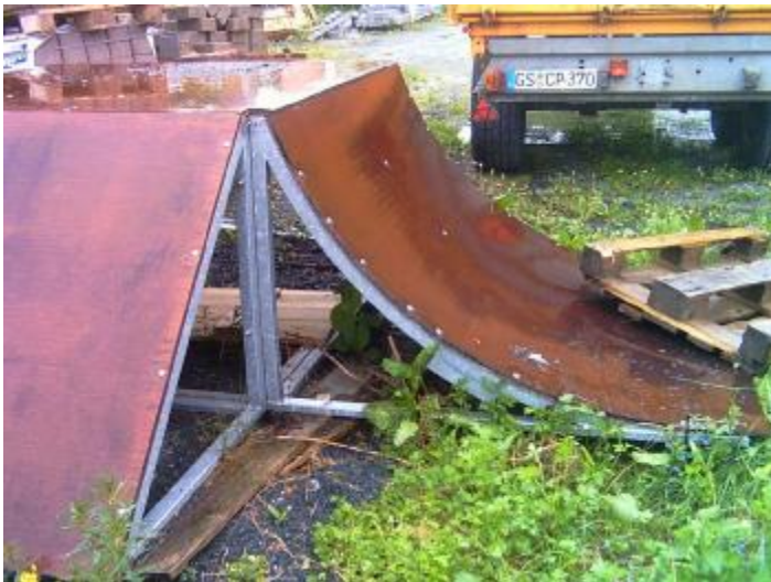
Die Skateboarder-Bahn (Ramp + Halfpipe) in Einzelteilen auf dem Bauhof gelagert

Der Kur- und Verkehrsverein Sankt Andreasberg e.V. kümmert sich intensiv um die "liegendebliebenen Angelegenheiten" der letzten Jahre. Als Freizeitangebot für Jugendliche hatte er nun schon vor Jahren mit Unterstützung der Firma Eckold eine Halfpipe bauen lassen. Einheimische Jugendliche würden sich genauso darüber freuen, wie Gäste-kinder, wenn es für das Gerät endlich einen Aufstellort geben würde.