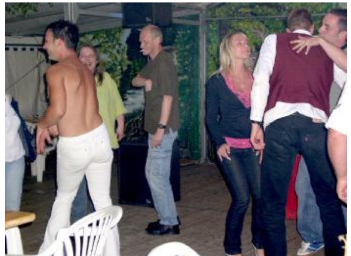
Puhh, ist das warm