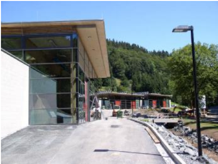
Neue Hallen für die Ausbildung

Am Freitag, den 24. August ist es soweit. Die Landesinnungsverbände des Dachdeckerhandwerks aus Niedersachsen, Bremen und Sachsen Anhalt weihen ihr neues Ausbildungszentrum an der Mühlenstraße in Sankt Andreasberg auf dem ehemaligen Gelände der Firma Sprenger ein.