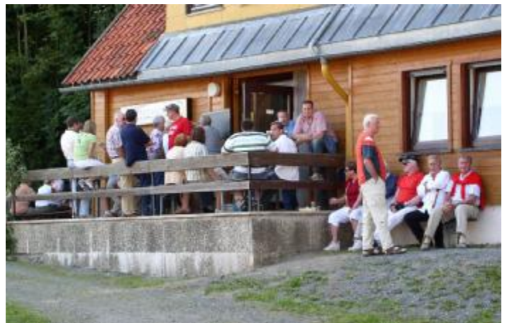
Im und am Schießhaus war Betrieb