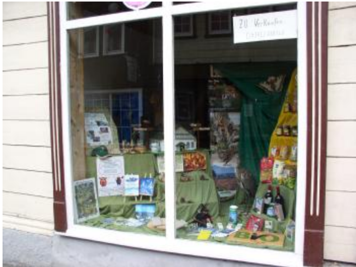
Schaufenster in der Dr.-Willi-Bergmann-Straße

In der letzten Ausgabe der Bergpost berichteten wir über die positive Wirkung gestalteter Schaufenster bei eigentlich leerstehenden Objekten. Eins davon, das Fenster für den Nationalpark ist nun fertiggestellt.