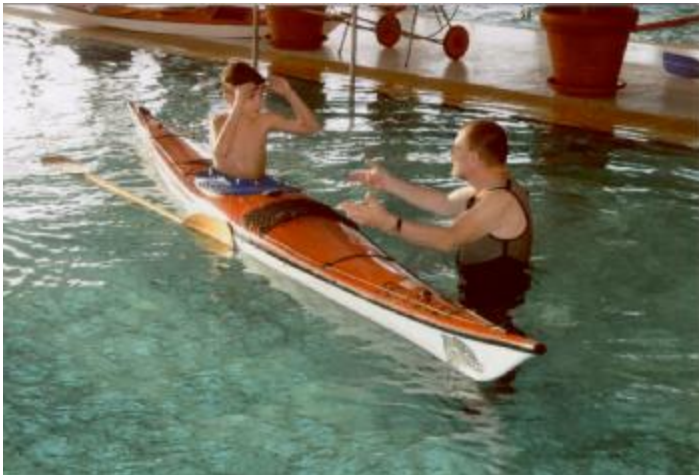
Kanu-Training im Panorama-Bad

heutzutage auch Kinder behutsam an den Sport heran.