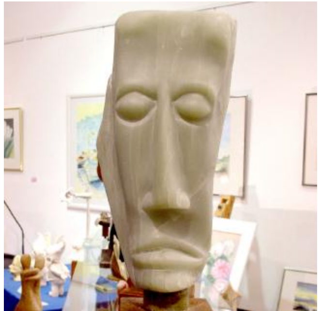
Wendehals Seite 2