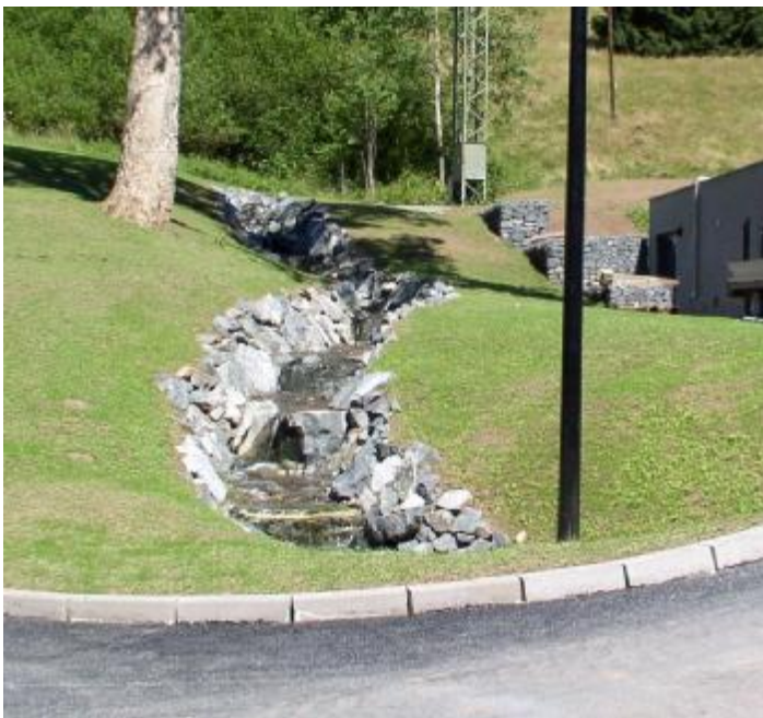
Außenanlagen im Detail

Nach nur einem guten Jahr Bauzeit sind die neuen hellen Hallen fertiggestellt und die Außenanlagen hergerichtet. Zur Einweihung werden der niedersächsische Kultusminister Busemann und Staatssekretär Andreas Storm aus dem Bundesministerium für Bildung und Forschung erwartet.