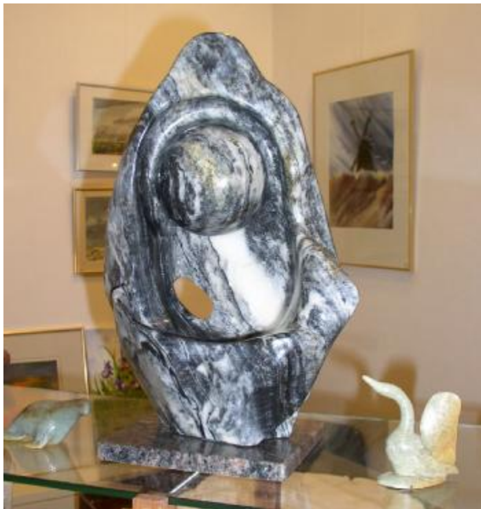
Wie könnte die Skulptur heißen? Das Auge?