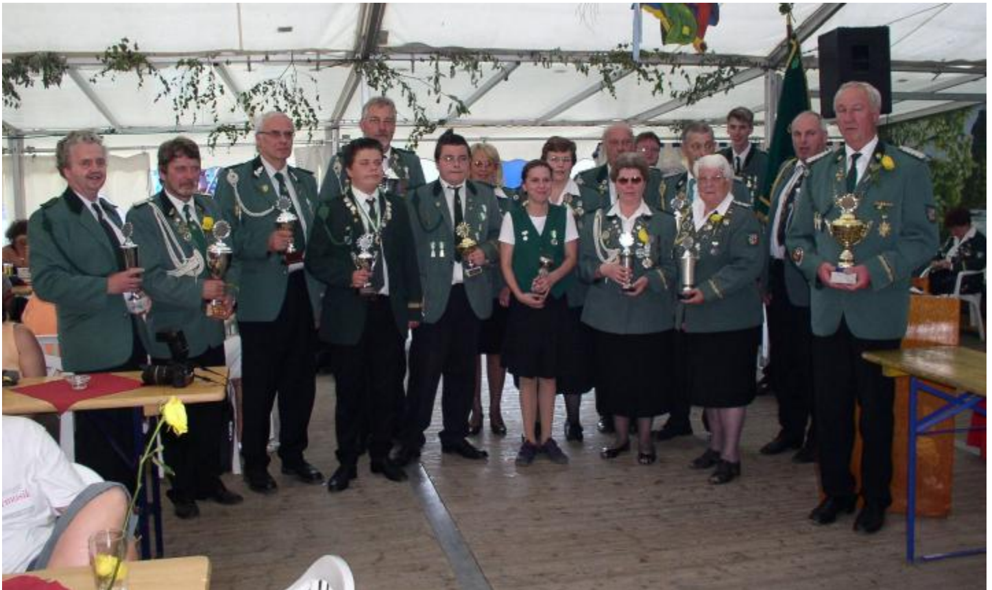
Die Pokalgewinner der Schützen 2007