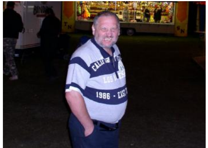
Ecki: grrr, gibt's hier nichts zu trinken?