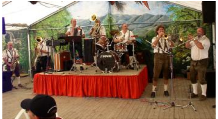
Die Bettelfanier mit ihrem jazzigen Sound

Am Sonntagnachmittag spielten die Bettelfanier. Mit ihren Jazz-Klängen brachten sie das Zelt schnell in Schwung.