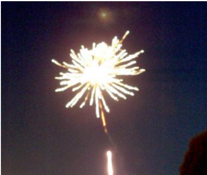
Höhenfeuerwerk am Festplatz

Mit einem Feuerwerk und anschließendem Tanz zu Diskorhythmen endete am Montagabend das große Volks- und Schützenfest auf dem Samson.