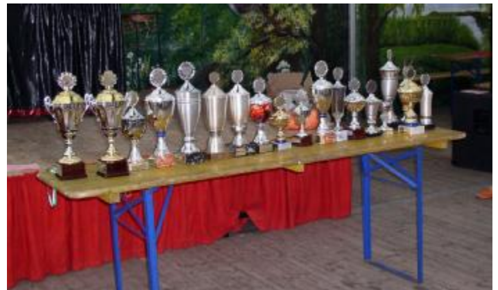
Die Pokale für die neuen Majestäten und Gewinner warten schon