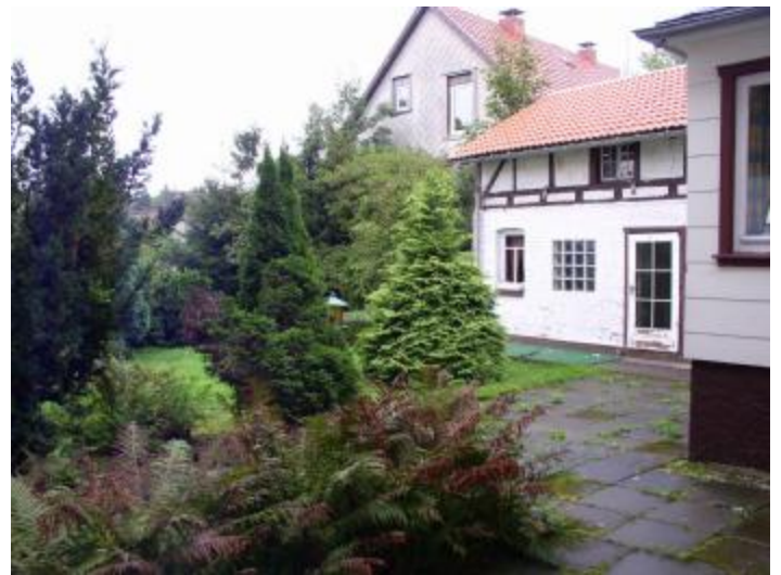
Hof und Garten mit über 400m 2 Fläche.

Schade nur, dass es kaum neue Gewerbetreibende mehr nach Sankt Andreasberg zieht. Das Haus hat 170m 2 und Nebengebäude. Außerdem könnte man auch den Garten nutzen. Ein Biergarten in der Innenstadt wäre schön.