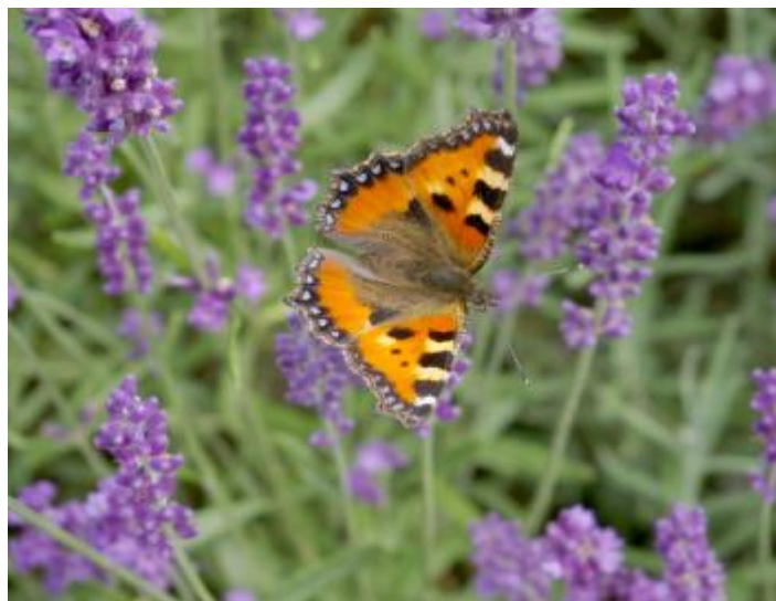
Kleiner Fuchs

verständliche Weise auf dieses Thema aufmerksam machen. Dabei erfahren die Besucher, wie wichtig eine Pflanzenvielfalt auf Feldern und Wiesen ist. Welche Folgen die eutige Landnutzung haben kann oder wie sich die Versiegelung der Flächen auf diese fliegenden "Verwandlungskünstler" auswirkt.