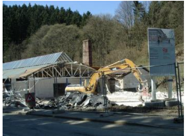
Der Bagger langte zu

Erst im Mai 2006 wurden die alten Hallen der Firma Sprenger abgerissen.