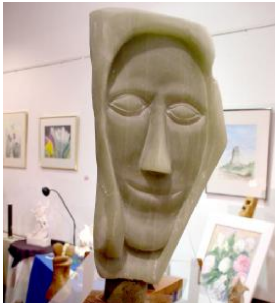
Wendehals Seite 1